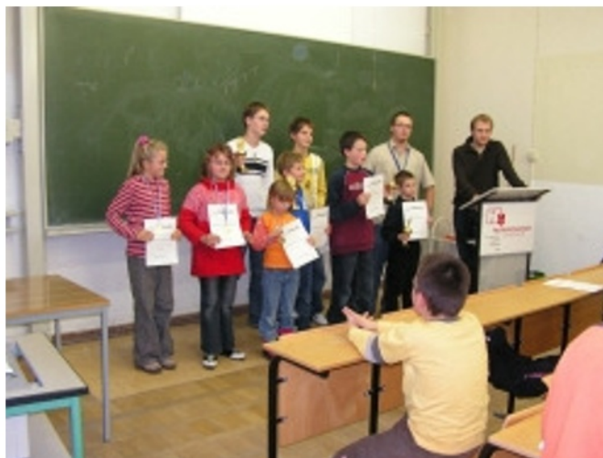
(Die Sieger des Schulschach-Cup 2006)

Ich möchte mich an dieser Stelle nochmals bei den vielen Helfern bedanken, die mich tatkräftig unterstützt haben und freue mich auf eine Fortsetzung dieses Events im Jahre 2007.