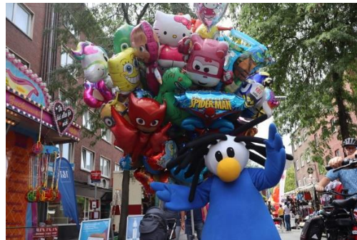
Chessy unterwegs in Duisburg

Dieses Jahr haben wir uns schon eine grobe Route mit Datum überlegt. Gerne möchten wir den Sommerferien hinterherreisen, damit wir auch unter der Woche viele Interessenten erreichen können. Weiter unten könnt ihr unsere angepeilte Tour finden,