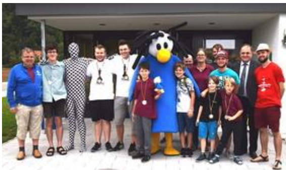
Chessy in Tegernheim

Die Schachtour hat sich in den letzten drei Jahren (2017, 2018 , 2019 , Video 2019 ) zu einem kleinen Highlight für Vereine, Teamer und Chessy entwickelt. Diese Freude wollen wir auch im Jubiläumsjahr 2020 weiterführen. Allerdings möchte Chessy 2020 gerne durch ganz Deutschland, um mit allen das Jubiläum zu feiern. Da eine solch groß angelegte Schachtour einiges an Organisation und Koordination benötigt, wird die Datumvergabe für die Verein etwas anders als bisher ablaufen.